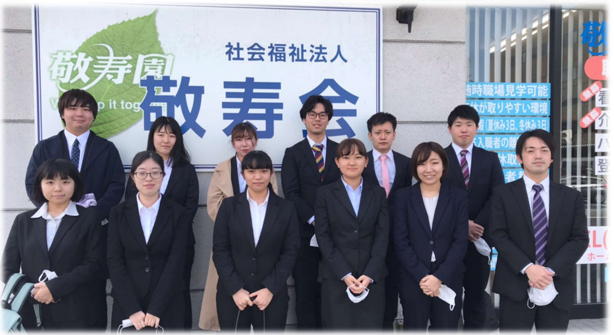
令和3年4月7日 本部事務局前での記念撮影（※撮影時のみマスクをはずしました）