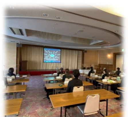
1～2日目 ヒルズサンピア山形にて研修