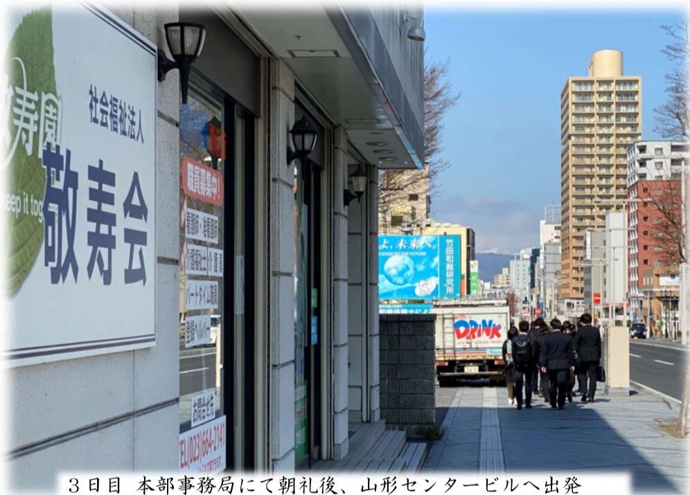
3日目 本部事務局にて朝礼後、山形センタービルへ出発