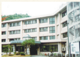
山形敬寿園 山形市大字妙見寺500-1