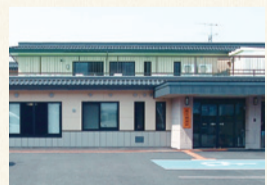
鈴川敬寿園 山形市大野目2-2-67