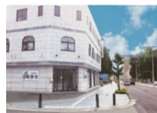
山形市諏訪町の敬寿会本部。

今年仙台敬寿園増床の認可が下りて、再来年に新しい施設を開設します。新しいことにチャレンジしつつも大切にしたいのは謙虚さと感謝の心。日々の生活の中でも葛藤はあるけれど、大事なことは感謝だと思えばそこで収まってしまう。そういう気持ちで、仕事を続けるための礎になっているのかもしれない。