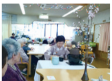
デイサービス具行事。初案でもてなし。