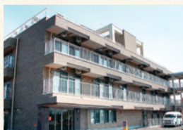
沼木敬寿園 山形市大字沼木68-1